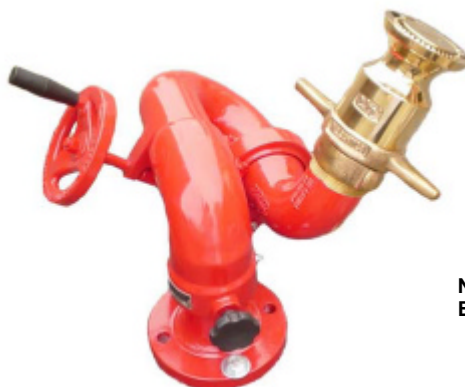
Na figura acoplado com Esguicho Fog Hog opcional